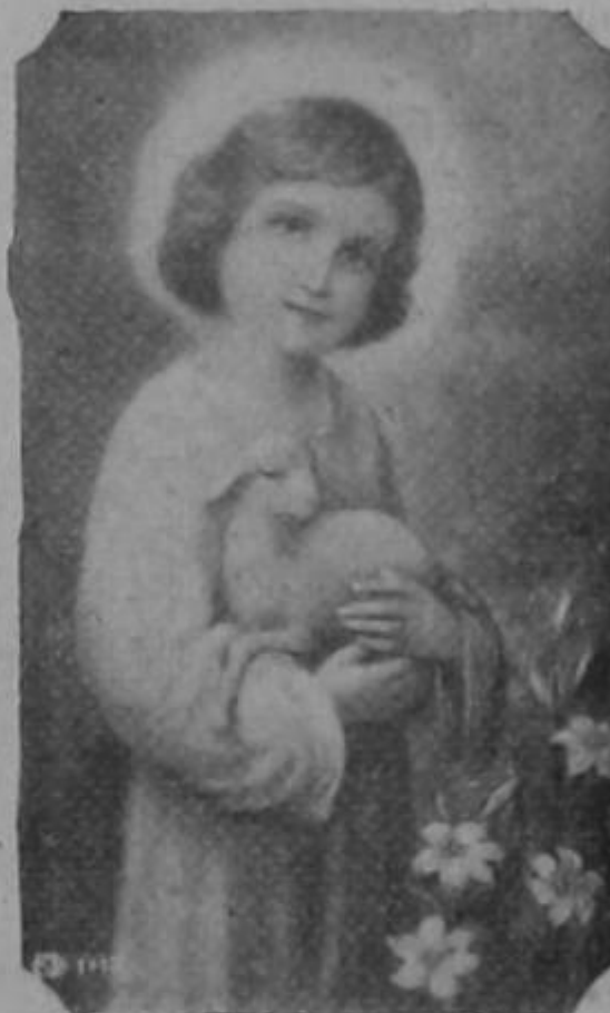
El Divino Cordero que se apacienta entre lirios

al que constituía el objeto de sus desvelos y esfuerzos.