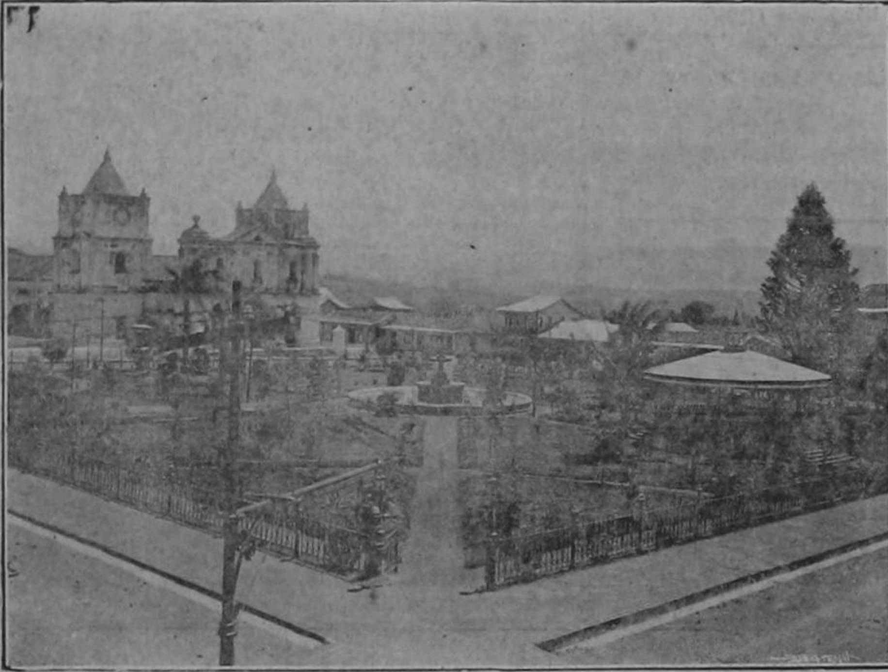
La Heredia de otros días, ciudad romántica, dulcemente dormida, pero fecunda, viva...